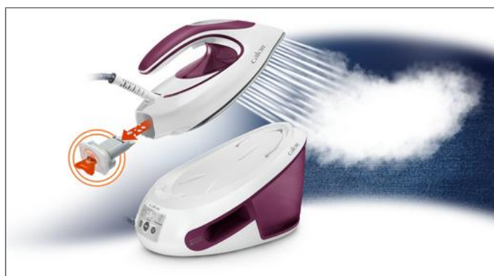
CENTRALE VAPEUR EXPRESS ANTI-CALC SV8054CO