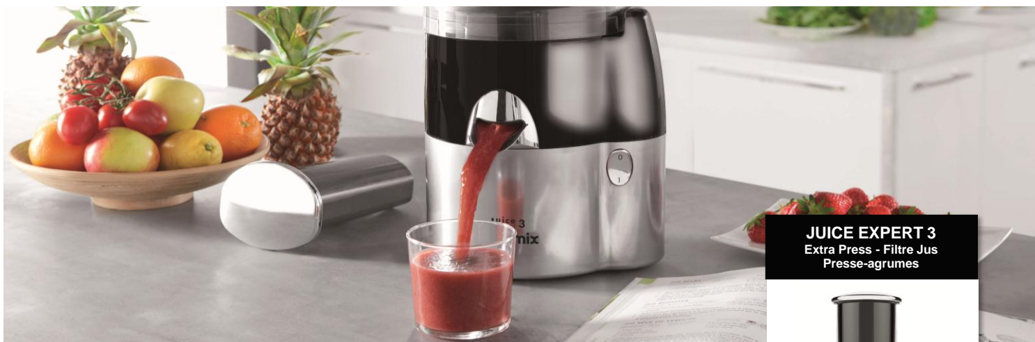
JUICE EXPERT 3 Extra Press - Filtre Jus Presse-agrumes