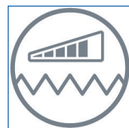
INDICATEUR DE SATURATION DU FILTRE